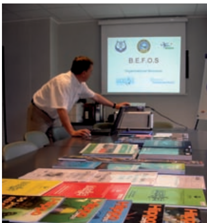
Een goede voorbereiding is het halve werk.