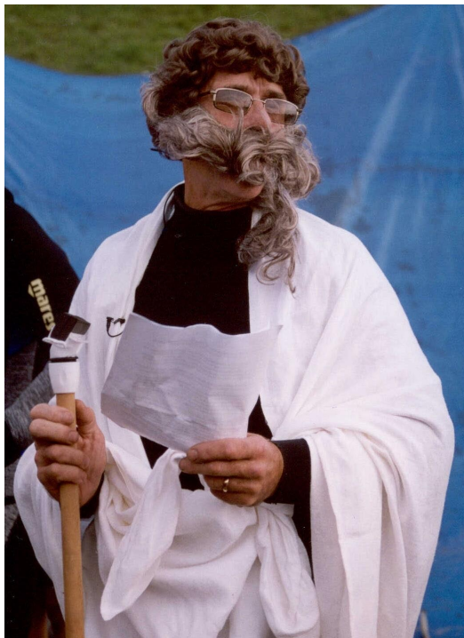
Bijlage 1: spotten met Neptunus zijn goede naam.

Sommige zaken mogen niet bij de haren getrokken worden. U als sportduiker zou het beter moeten weten dan wie dan ook. Het is dankzij de goedheid van Neptunus dat u al die prachtige natuur mag bewonderen, en nu neemt u zijn naam licht in de mond! Denkt u dat hij het zelf prettig vindt om elke keer als u gaat duiken in zijn territorium, een aantal vrijwillige krabben, slakken, kreeften, vissen en sepias moet vinden die zich "per toeval" op uw weg moeten begeven, teneinde de duik niet helemaal oersaai te maken? Dankbaarheid en respect!